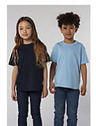
SOL'S Imperial KIDS 11770